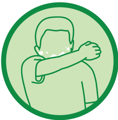
ไอหรือจามเข้าข้อพับ แขนของคุณ