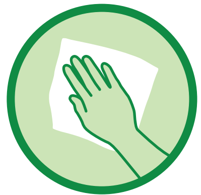
ทำความสะอาดพื้นผิวอย่าง สม่ำเสมอ